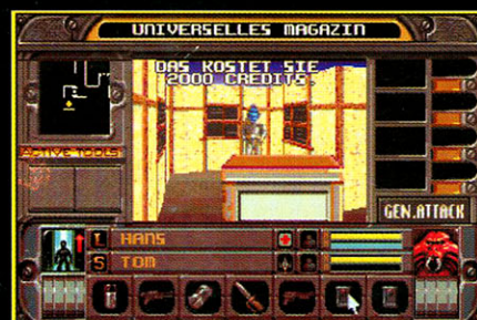
WHALE'S VOYAGE II