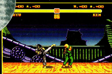
S. STREETFIGHTER 2

Die Software benötigt in der Regel Amiga-OS 2.0 sowie 1 MByte Speicher. Bei Kickstart 1.3 nur sehr eingeschränkte Nutzung möglich!